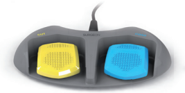
SURGEON sterownik nożny